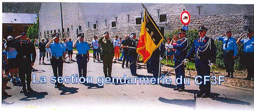
La section gendarmerie du CF3F

L'année passée nous vous présentions l'association CF3F, active sur le site de la gare de Hombourg.